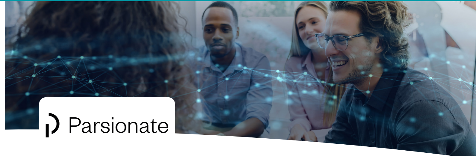
Produktübersicht, verfügbar in 15 Sprachen