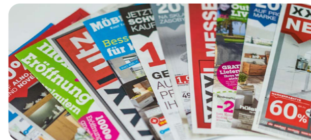
Maßgeschneiderte Softwarelösung für die Flugblatt-Produktion.

Die Grob- und Feinplanung der Kampagnen wird nun in der Kampagnen-Management-Lösung systemgestützt und, wo es geht, automatisiert durchgeführt. Mit einem ausgeklügelten Rechte- und Rollenkonzept wurden die Verantwortungen systemgestützt definiert und das erklärte Ziel, einen effizienten und fehlerfreien Produktionsprozess zu etablieren, erreicht. Die Vorteile des medienbruchfreien Arbeitens haben überzeugt, so dass die Lösung von Premedia mittlerweile in vielen anderen Werbemittelproduktionen (Mailings, Inserate, Scheckhefte, Verpackungen, ...) eingesetzt wird.